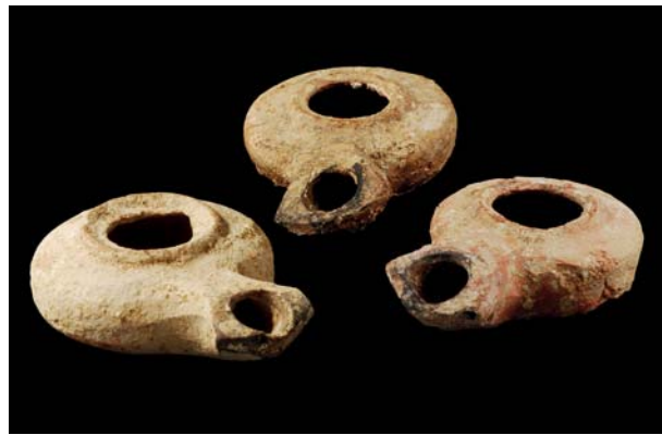
Fig. 7: Llànties jueves de l'època de Jesús (MBT)

Joan (no ho sabem de cert) a punt de cobrir-lo amb el llençol 5 . Les vestimentes dels personatges femenins i masculins han estat realitzades a partir de criteris reconstructius 6 . Distingim diferents objectes per a l'arranjament del cadàver com les balsameres o unguentaris. Al Museu Bíblic es conserven alguns exemplars de