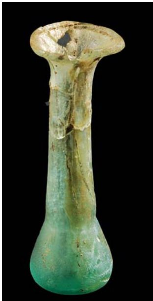
Fig. 6: Ungüentari o basalmèra procedent de Jerusalem (MBT)

Al Museu Bíblic Tarraconense es pot apreciar una reconstrucció ideal del sepulcre de Jesús (fig. 2). Al fons del diorama una pintura representa la porta de la muralla de Jerusalem i la vista del Gòlgota. L'orientació de la sepultura en relació al dibuix de fons està alterada per tal que pugui ser vista per l'espectador i posada en relació al Gòlgota i la ciutat. La maqueta és obra de l'artista vendrellenc Jordi Lluís Rovira i les figures de l'artista de Conca, Carlos Delgado, seguint les directrius de l'equip del Museu. Es pot apreciar Maria Magdalena i Maria, mare de Josep davant la sepultura (fig. 3). A la avantcambra apareix el cadàver de Jesús (fig. 4), al damunt de la llosa, arranjat i amb la mandíbula lligada. Josep d'Arimatea, Nicodem i tal vegada un servent o el mateix