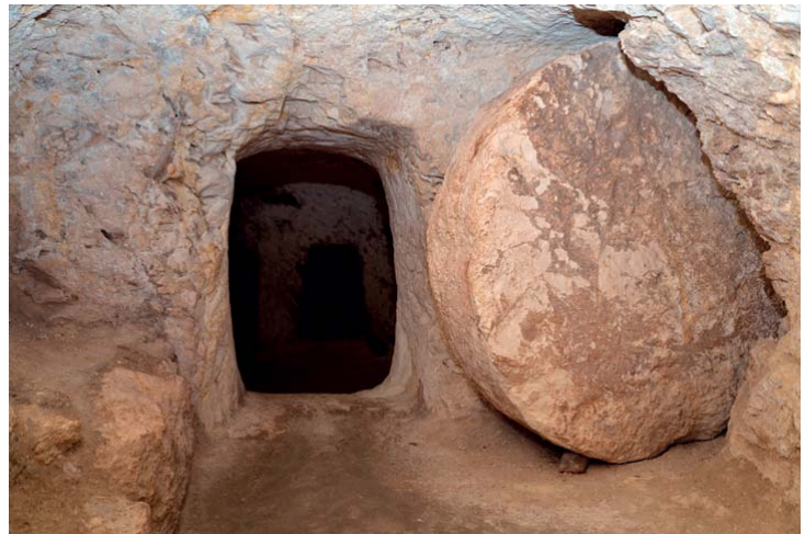
Fig. 1: Entrada d'una tomba jueva d'època antiga.

Els quatre evangelistes (cf. Mt 27,57-61; Mc 15,42-47; Lc 23,50-56; Jn 19,38-42) citen que Josep d'Arimatea, deixeble de Jesús i membre del Sanedrí, va demanar a Pilat l'autorització per a treure el seu cos de la creu. Pilat hi va accedir. Josep acompanyat per Nicodem despenjaren el cos de Jesús de la creu i el transportaren fins a un sepulcre. Segons el relat de Joan, el sepulcre estava en un hort a l'indret on havien crucificat Jesús 1 . Era un hipogeu excavat a la roca que es tancava fent rodolar una gran pedra (Mt 27,60; Mc 15,47; Lc 23,53). El sepulcre era nou i no l'havia fet servir ningú. En el moment de la sepultura es trobaven Josep d'Arimatea, Nicodem, algun o alguns servents a les ordres de Josep i a més Maria Magdalena i Maria, mare de Josep, assegudes davant el sepulcre (Mt 27,61) 2 . La comitiva fúnebre portà una barreja de mirra (resina aromàtica) i àloe (perfum), que